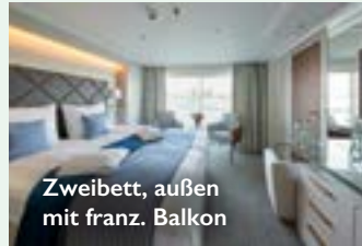
Zweibett, außen mit franz. Balkon

Ihre Zahlungen sind gemäß der gesetzlichen Bestimmungen über DRSF, Deutscher Reiseversicherungsfonds GmbH, Sächsische Straße 1, 10707 Berlin, versichert.