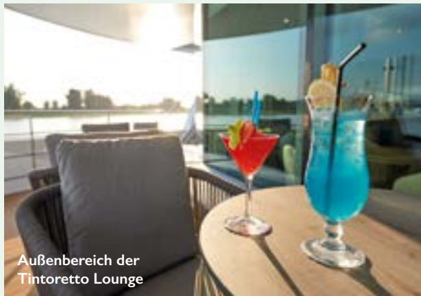
Außenbereich der Tintoretto Lounge